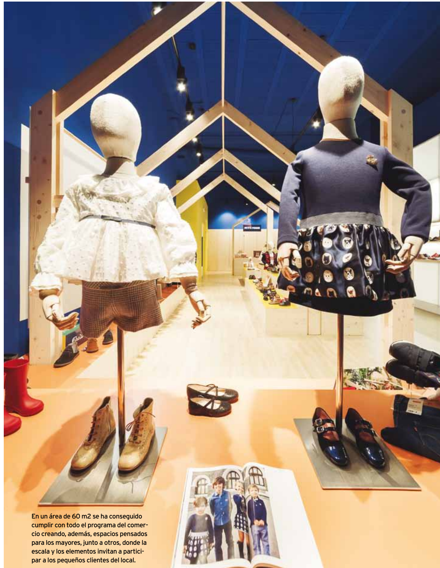
En un área de 60 m2 se ha conseguido cumplir con todo el programa del comercio creando, además, espacios pensados para los mayores, junto a otros, donde la escala y los elementos invitan a participar a los pequeños clientes del local.